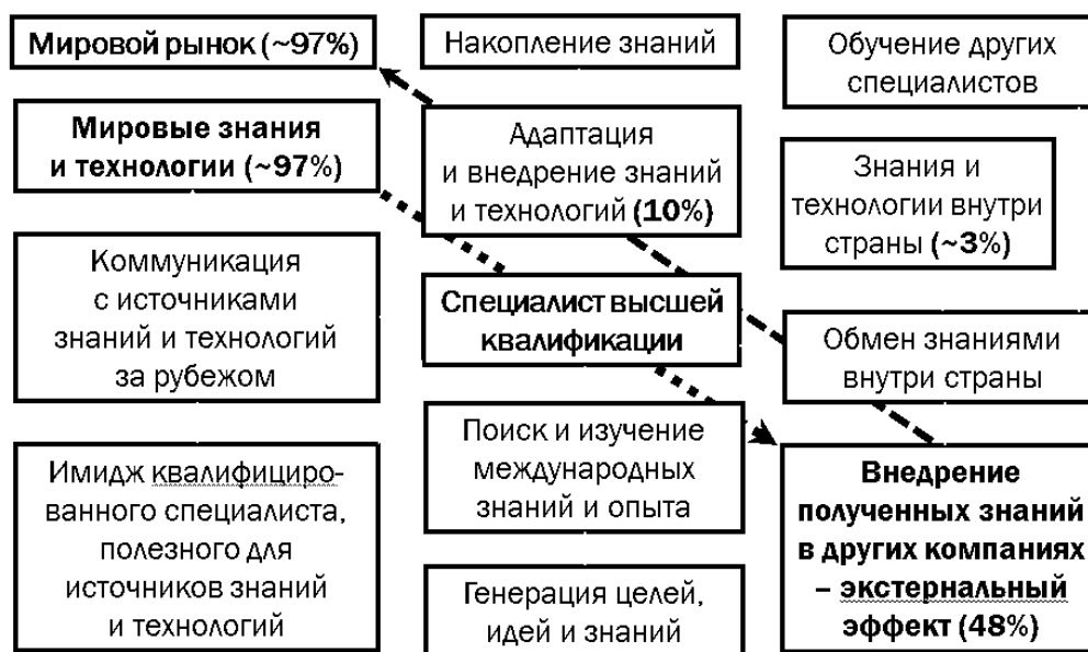
Рис. 5. Функции специалистов высшей квалификации

Рассмотрим, какие функции выполняет на этом рынке специалист высшей квалификации по передовым технологиям (рис. 5).