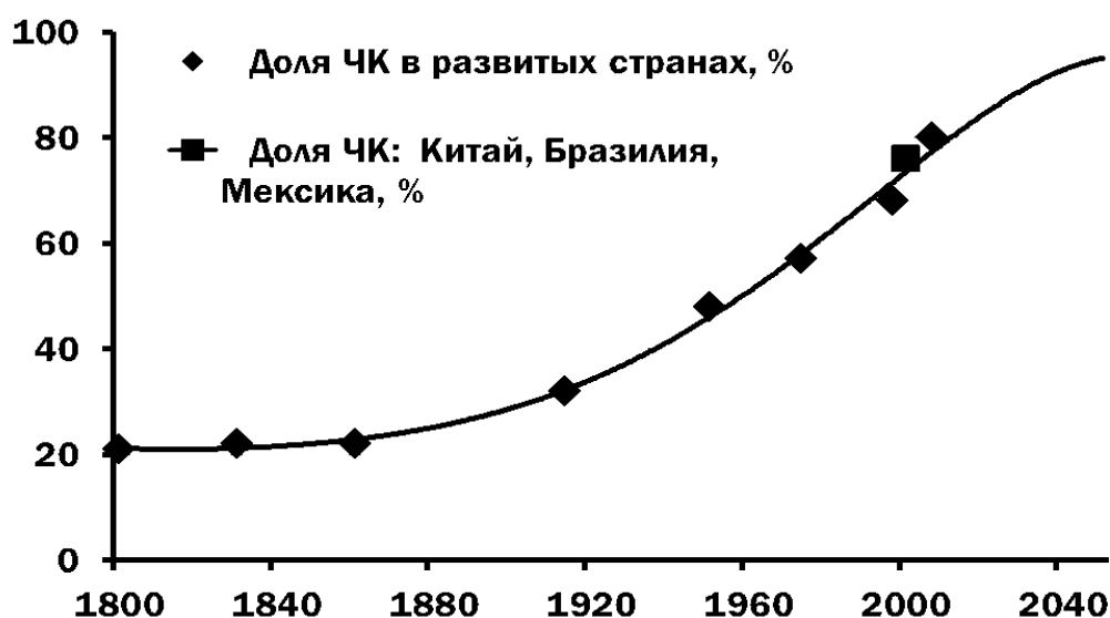
Рис. 1. Доля человеческого капитала в национальном богатстве стран [1]

4. Стоимостный, основанный на том, что из расчета совокупного богатства страны вычитают физический и природный капитал, а остаток принимают за величину ЧК.