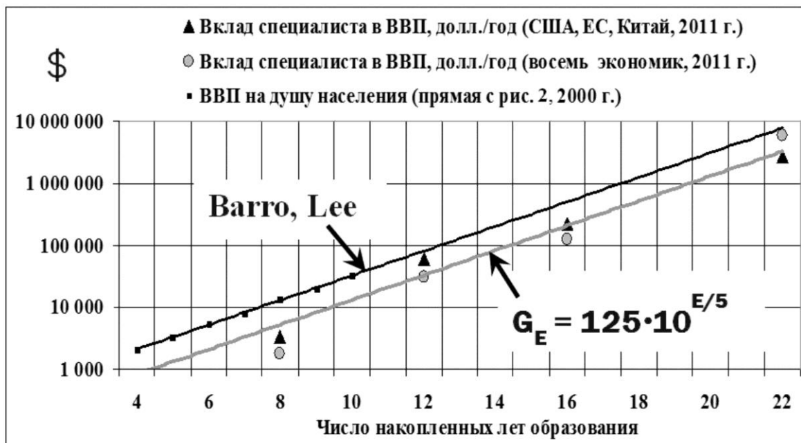
Рис. 3. Влияние образования специалиста на вклад в ВВП

Поскольку по оси ординат здесь отложен логарифм ВВП, это значит, что в линейной системе координат зависимость является экспоненциальной. На основании чего будем именовать ее «Образовательной экспонентой». Таким образом, с ростом образовательного уровня населения ВВП стран возрастает очень быстро. Высокообразованные специалисты вносят существенно больший вклад в ВВП страны, чем менее образованные. Согласно формуле (3) – каждый год образования увеличивает вклад специалиста в ВВП страны на 58%. При этом рост доходов компании составляет всего порядка 10%.